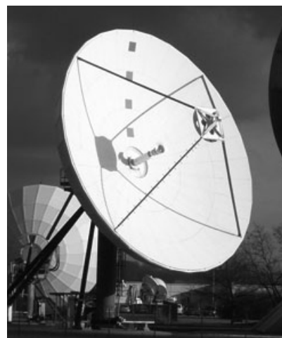
Die Innovationsförderung bündeln, nicht teilen

In ihrer Stellungnahme zur Teilrevision des Bundesgesetzes über die Forschung (Forschungsgesetz FG) fordern die akademien-schweiz, dass die Innovationsförderung des Bundes in einer organisatorischen Einheit zusammengefasst bleibt. Sie sprechen sich dafür aus, dass die Kommission für Technologie und Innovation (KTI) in eine Stiftung überführt wird.